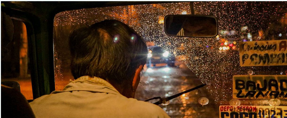
صورة: داخل مركبة جيني في دافاو، الفلبين

فإن محركات مركبات الجيني التقليدية... تبلغ [نحو] 15 إلى 20 سنة من العمر... وهي حارة جداً على أقدامهم. [وبسبب الحرارة] يحف العرق على ظهورهم. وهذا يشكل خطراً عليهم. وهم لا يستطيعون التوقف لأن... عليهم أن يواصلوا الدفع من أجل أقساط مركباتهم، والوقود، و[المبلغ] الذي يعودون به إلى منازلهم."