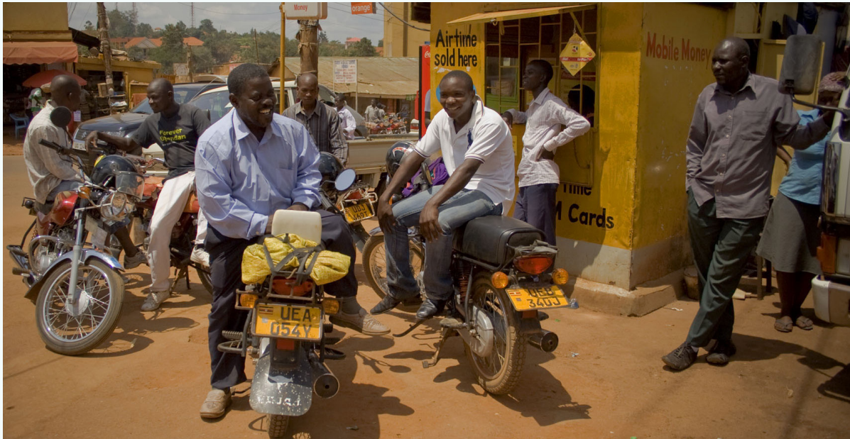
صورة: سائقو مركبات بودا بودا في كمبالا، أوغندا

وتوفر هذه النتائج رؤى هامة تبرز الإجراءات التي يجب على صانعي القرار اتخاذها في مؤتمر COP26 والمؤتمرات اللاحقة.