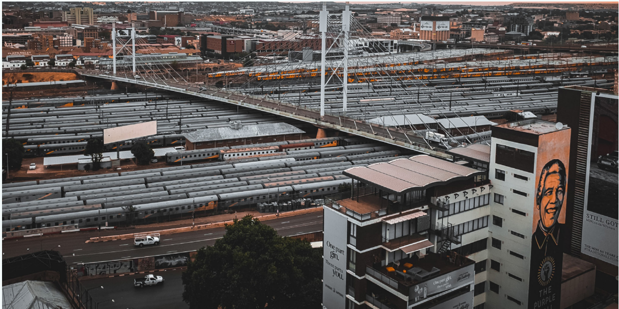
صورة: القطارات تحت جسر ماندبلا في جوهانسبرغ، جنوب أفريقيا، بواسطة تيمبينكوسي سيكوببلا | المصدر: Unsplash

كما وصف الأشخاص الذين أجريت معهم المقابلات مجموعة من القضايا الأساسية مثل: التمويل القصير الأجل المرتبط بالدورات السياسية والجهات التي تتحكم في الإنفاق؛ والضغط من قبل جماعات المصالح الأخرى على حساب النقل العام؛ و سياسات الخصخصة والتحول إلى القطاع غير الرسمي ، وحتى الفساد في بعض الحالات؛ و المفاهيم الضيقة التي تضع النقل في موقف صعب ، وتفترق إلى كيفية ارتباطه بمجالات السياسة العامة مثل البيئة والصحة والتنمية.