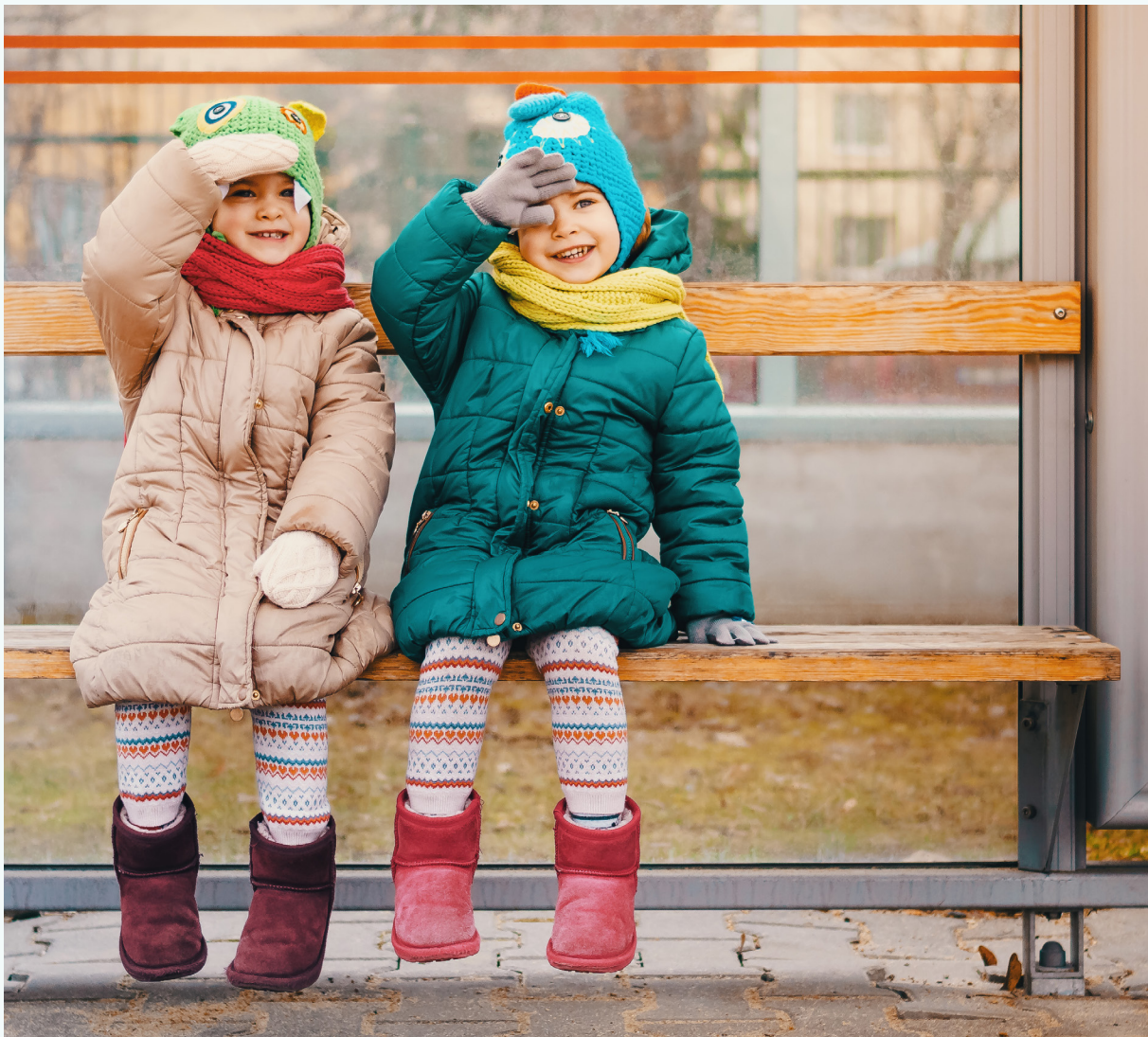
صورة: طفلان في محطة الحافلات في وارسو، بولندا بواسطة أوسكا26 | المصدر: iStock

نحن بحاجة إلى الاستفادة من مهارة قادة المدن والمسؤولين وعمال النقل ودعم تفانيهم من خلال توفير دعم مالي حكومي فوري مستقر وطويل الأجل. إن مضاعفة نسبة رحلات النقل العام في المدن، من أجل إبقائنا على مسار الإحتترار العالمي عند درجة حرارة لا تتجاوز 1.5 درجة مئوية، يتطلب من الحكومات في مختلف أنحاء العالم أن تترجم أقوالها إلى أفعال وتتخذ قرارات مالية شجاعة. لقد حان وقت العمل الآن. المستقبل هو النقل العام.