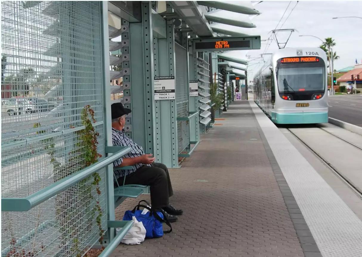
صورة: محطة سكة حديد خفيفة في فينيكس بالولايات المتحدة الأمريكية

في فينيكس، وهي مدينة تغطي مساحة كبيرة، حيث تتم معظم التنقلات باستخدام المركبات الخاصة، أيد الناخبون استثمارات كبيرة في وسائل النقل العام في عام 2015. وقد أوضح المسؤولون في المدينة، أنهم بعد أن استثمروا بالفعل في أسطول من المركبات النظيفة بيئياً، بدأوا في زيادة عدد المسارات، ثم زادوا في مواعيد الرحلات المبكرة والمتأخرة، ثم زادوا من تردد وتنسيق مواعيد الحافلات والسكك الحديدية الخفيفة. ثم ناقشوا النهج مع المجتمع المحلي وأدخلوا مواقع المجتمعات الأكثر ضعفاً ضمن تخطيطهم. ومع ارتفاع درجات الحرارة إلى مستويات عالية جديدة، نظروا في كيفية جعل وسائل النقل العام أكثر جاذبية، مع تبنيهم مبادرات مثل الممرات المظلة، حتى يتمكن الناس من الوصول إلى الحافلات وانتظارها بشكل أكثر راحة. وقد شهد هذا النهج ارتفاعاً في أعداد الركاب قبل انتشار الوباء، فضلاً عن ردود فعل إيجابية من جانب الأشخاص الذين لم يستخدموا وسائل النقل العام في الماضي.